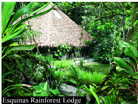
Esquinas Rainforest Lodge